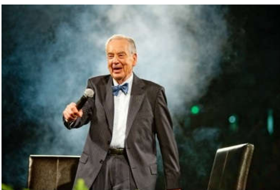
ซิก ซิกลาร์ (Zig Ziglar)

รายงานฉบับนี้จัดทำขึ้นโดยข้อมูลเท่าที่ปรากฏและเชื่อว่าเป็นที่น่าเชื่อถือได้แต่ไม่เป็นการยืนยันความถูกต้องและความสมบูรณ์ของข้อมูลใดๆ โดยบริษัทหลักทรัพย์ ยูโอบี เคย์ เฮียน (ประเทศไทย) จำกัด (มหาชน) ผู้จัดทำขอสงวนสิทธิ์ในการเปลี่ยนแปลงความเห็นหรือประมาณการที่ปรากฏในรายงานฉบับนี้ โดยไม่ต้องแจ้งล่วงหน้า รายงานฉบับนี้มีวัตถุประสงค์เพื่อใช้ประกอบการตัดสินใจของนักลงทุน โดยไม่ได้เป็นการชี้แนะให้ลงทุนในหลักทรัพย์หรือขายหลักทรัพย์ หรือตราสารทางการเงินใดๆ ที่ปรากฏในรายงาน